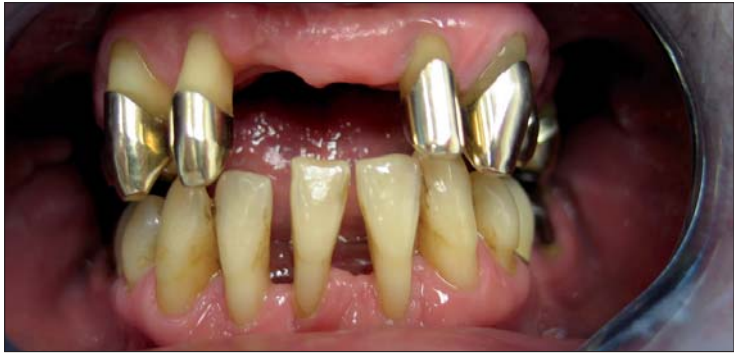
Abb. 1: Parodontal vorgeschädigter Patient acht Jahre nach Initialtherapie – Der Zustand ist langfristig stabil.

In Deutschland stehen den wahrscheinlich 35 Millionen Menschen, die Anzeichen einer parodontalen Erkrankung aufweisen, nur etwa eine Million Parodontaltherapien gegenüber. Dass hier noch ein deutlicher Handlungsbedarf besteht, ist offensichtlich. Zumal die Zusammenhänge zwischen der oralen und der allgemeinen Gesundheit evident sind.