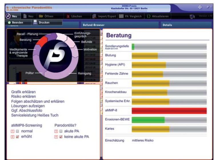
Abb. 3: Bildschirmfoto ParoStatus.de-Software – rechts Zusammenfassung der Befunde mit Risikoanalyse, links oben Systematik der Prophylaxesitzung.

Je nach den ermittelten Befunden erfolgt die Zuordnung der Betroffenen zu einer von drei Risikogruppen. Eine farbliche Darstellung der unterschiedlichen Parameter im Programm (Ampelfunktion) dient der zusätzlichen optischen Orientierung