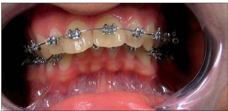
Abb. 2: Plaquefreiheit – auch bei Patienten mit erhöhtem Schwierigkeitsgrad.

Warum werden viele Parodontalerkrankungen nicht erkannt? Sicherlich werden einige der Erkrankten nicht in Zahnarztpraxen vorstellig. Teilweise werden in den Praxen die Erkrankungen auch nicht ausreichend diagnostiziert. Gelegentlich entwickeln aber auch Patienten/-innen, die sich regelmäßig in der Praxis vorstellen, unbemerkt eine Parodontitis. Man kennt Patienten/-innen über viele Jahre, kontrolliert in festen Abständen die Hartsubstanz und übersieht die Veränderungen im Weichgewebe. Um dieses zu verhindern, ist eine standardisierte, dokumentierte und reproduzierbare Diagnostik notwendig. Diese Diagnostik muss auch über Jahre nachvollziehbar und vergleichbar sein. Nur so können Veränderungen frühzeitig auffallen und eine schnelle Intervention möglich machen.