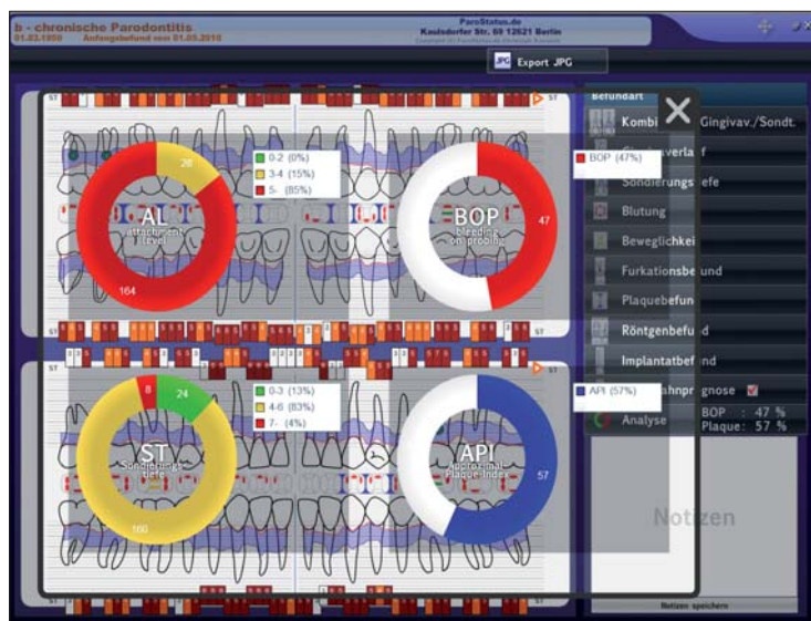
Abb. 6: Bildschirmfoto ParoStatus.de-Software – Schnellanalyse des parodontalen Befundes.

einer Neubewertung des persönlichen Risikos werden eventuell notwendige, neuerliche Behandlungsschritte festgelegt, Maßnahmen zur Intensivierung beziehungsweise Verbesserung der Compliance besprochen sowie die Recallabstände individuell angepasst.