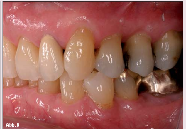
Abb. 1-3: 53-jährige weibliche Patientin mit Verdacht auf aggressive Parodontitis nach 9 Jahren im regelmäßigen Recall (4 x jährlich) und guter Compliance. – Abb. 4-6: 82-jähriger männlicher Patient mit generalisierter chronischer Parodontitis nach 27 Jahren im regelmäßigen Recall (3-4 x jährlich).

Andererseits können die Immunabwehr, eine gute Mundhygiene sowie eine engmaschige Patientenbetreuung das Krankheitsrisiko mindern. Am Ende entscheidet die Überlegenheit einer Seite, ob die Krankheit weiter fortschreitet, aufgehalten wird oder sogar die Heilung beginnt. Der Patient trägt mit seinen Verhaltensweisen (Compliance) im Wesentlichen dazu bei, in welche Richtung diese Reise geht. Wichtige Waffen in diesem Kampf sind einerseits eine stetig rekurrierende und ausführliche Aufklärung, Motivation und Instruktion des Patienten zur Steigerung der Eigenverantwortung; auf der anderen Seite aber auch eine gute Diagnostik und Patientenführung durch das zahnärztliche Team.