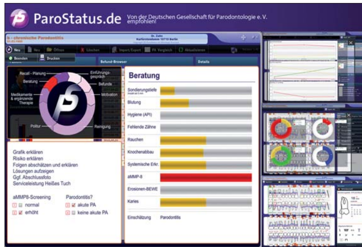
Abb. 8: ParoStatus.de-System – von der DGP empfohlen.